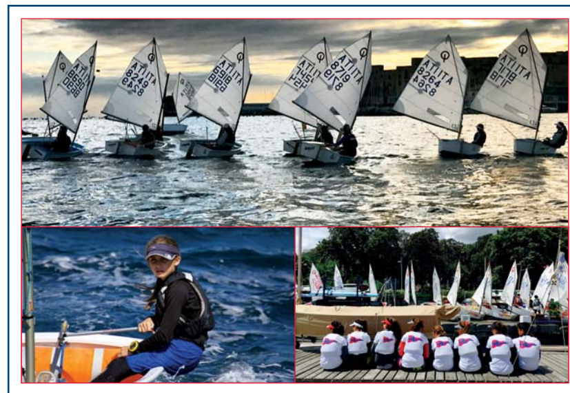
Le nostre imbarcazioni

Agli allievi saranno forniti dal Circolo la tessera e il diploma della Federazione Italiana Vela (FIV), materiale didattico FIV, un cd delle foto scattate durante i corsi, gadget CRVI e premi.